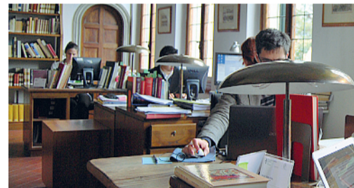
Gli studiosi in una delle sale