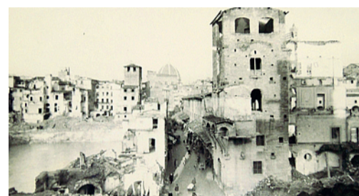
Le macerie di Firenze dopo la guerra